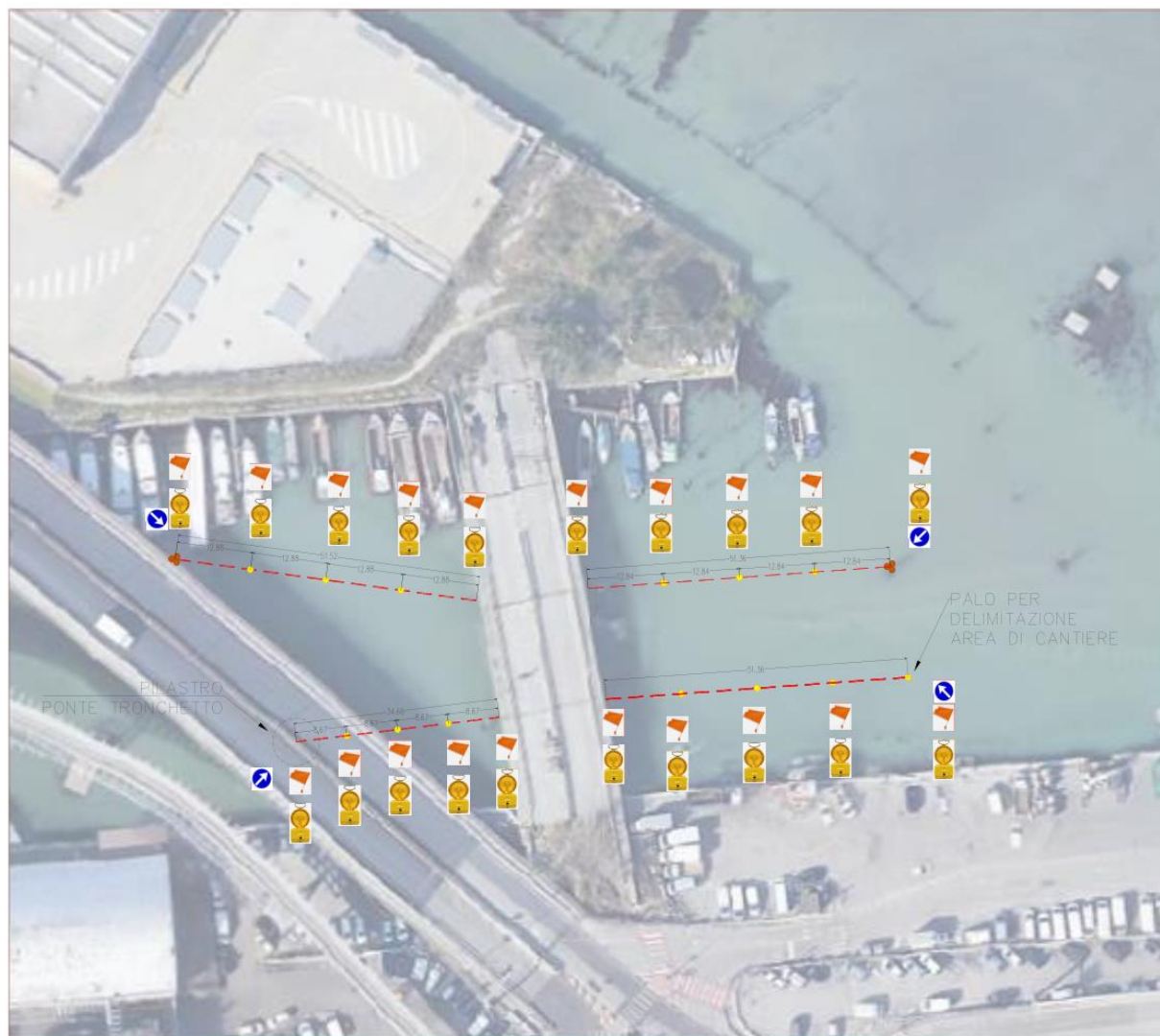
PONTE DISMESSO SU CANALE COLOMBUOLA DELIMITAZIONE AREA CANTIERE CON OPPORTUNA SEGNALETICA-VISTA PIANTA